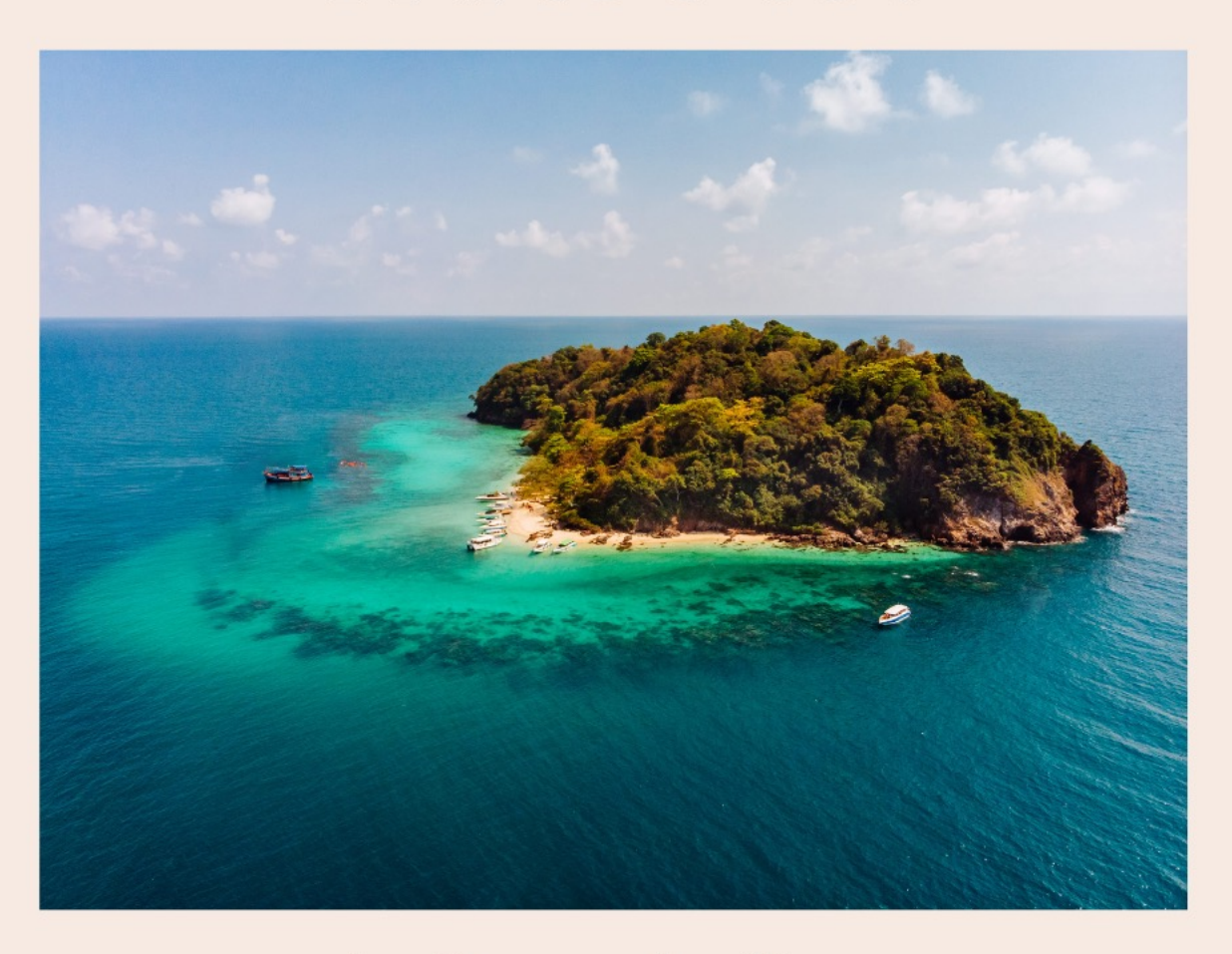
laðan laða makola