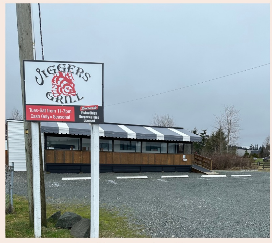
laðan laða hama?ēlas