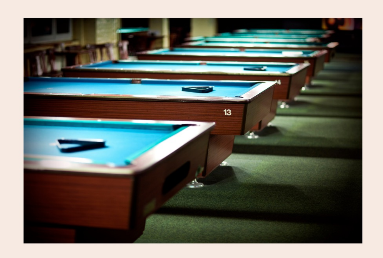
laðan laða Áamgwilas