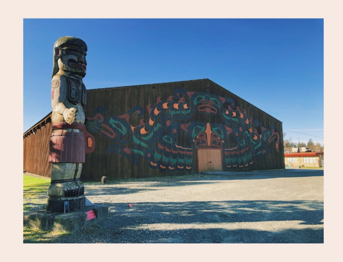
laðan laða gukwd²i