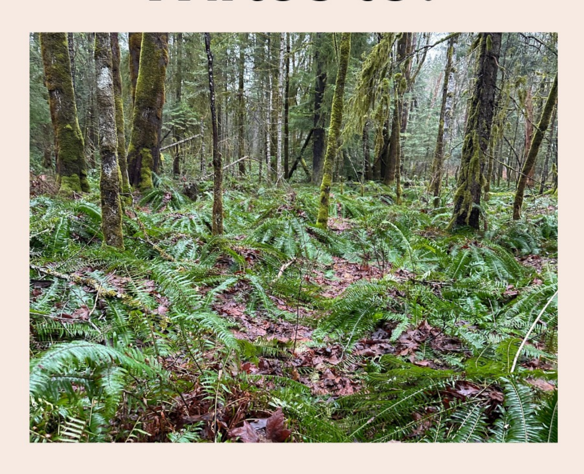
laλən laxa ?aλi