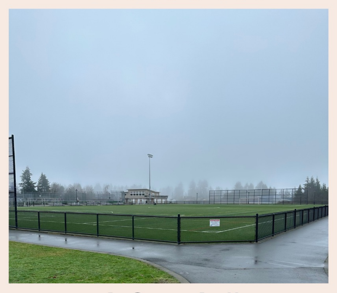
laðan laða qayakidzas