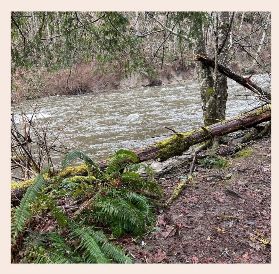
laðan laða wa