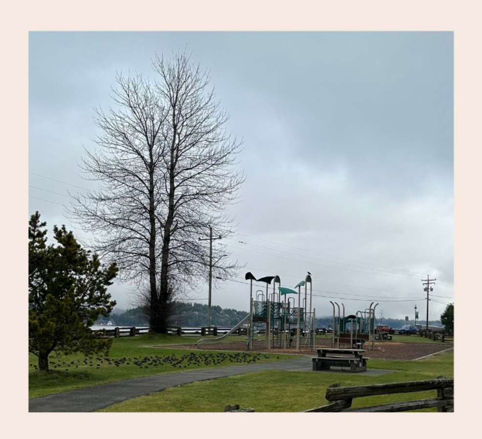
laðan laða ?əmlid²as