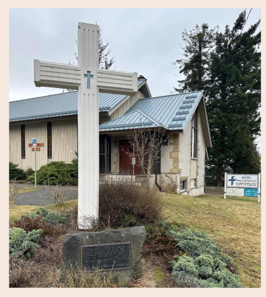
laðan laða ćamaći