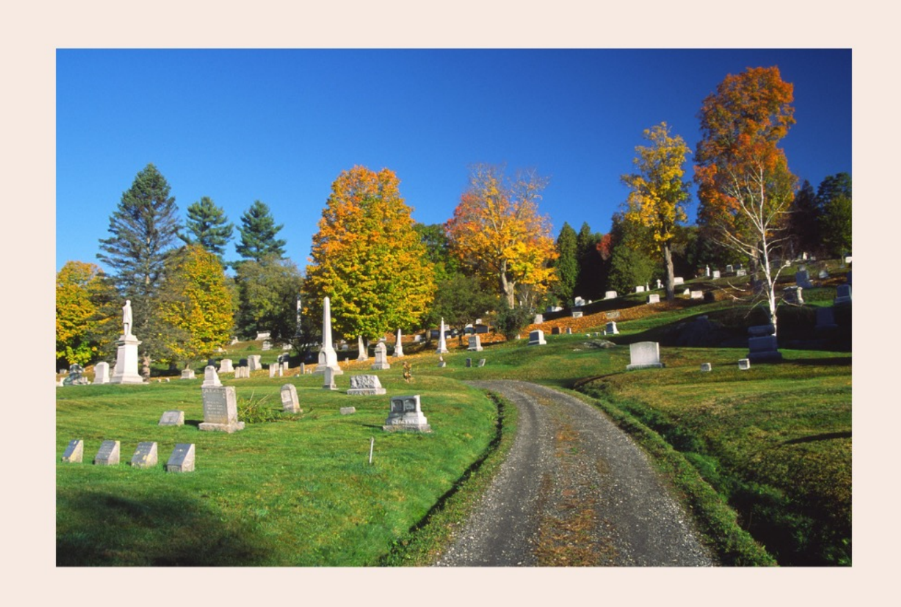
laðan laða dagidzas